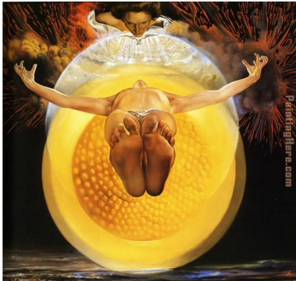
Salvador Dalí, 'Ascension of Christ', 1958.