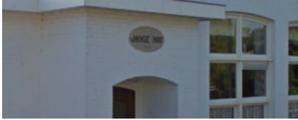
't Hoge Hof – 1956.

In de jaren '60 ontstonden plannen om 't Hoge Hof' op te knappen en er ook wat meer mogelijkheden van vertier voor de jeugd in aan te brengen. Een rondgang door de gemeente bracht voor het gestelde doel maar liefst fl. 7.000 op, zodat de plannen konden worden uitgevoerd. Ook de kerk zou worden opgeknapt. Er kwam een stevig plan dat echter te ambitieus was, zodat uiteindelijk besloten werd de preekstoel en de ambtsdragersbanken wat op te pimpen. En omdat de functie van voorlezer tóch was afgeschaft kon ook het voorlezersbordje verwijderd worden. Tegelijk werd ook het 'doophek' vóór de preekstoel weggehaald.