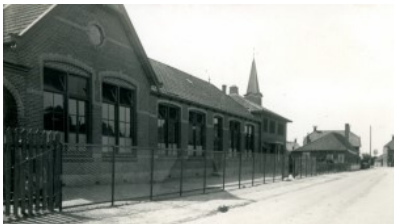
De christelijke school aan de Schoolstraat, een eind achter de kerk.

De vergaderruimte werd steeds krappere door de toenemende kerkelijke activiteiten en vergaderingen. Men moest geregeld uitwijken naar andere locaties in het dorp, omdat de consistorie en de school lang niet de ruimte boden die nodig was. Maar juist in die tijd, begin jaren '50, waren er plannen om een nieuwe christelijke school te bouwen en wel op dezelfde plaats als de oude, een eindje achter de kerk. Men zag echter af van nieuwbouw op de oude locatie, maar ging elders een nieuwe school bouwen, zodat de kerkeraad in de gelegenheid was het oude schoolgebouw eind 1952 over te nemen voor de prijs van fl. 6.500. Men wilde de school verbouwen en er een jeugd- c.q. verenigingsgebouw van maken.